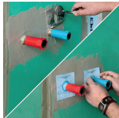
2c. Auch zum Abdichten der Wasserzuleitungen mit der Dichtmanschette PCI Pectape 10 x 10 wird zunächst ausreichend viel Abdichtungsmaterial PCI Lastogum vorgelegt. 2d. PCI Pectape 10 x 10 über den aus der Wand herausstehenden Rohrabschluss stülpen und mit PCI Lastogum verkleben.