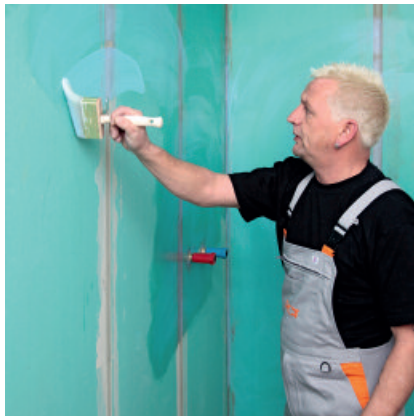
1. Grundierung PCI Gisogrund flächendeckend auftragen.

Nach mindestens zwei Stunden Abluftzeit der zweiten Abdichtungsschicht können Fliesen und Platten mit PCI Flexmörtel® oder PCI Nanolight® auf die durchgetrocknete PCI Lastogum®-Dichtschicht verlegt werden. Hierzu mit der glatten Seite einer Stahlkelle eine dünne Kontaktschicht auf den Untergrund auftragen und mit einer Zahnkelle auf die Kontaktschicht soviel Mörtel aufkämmen, wie innerhalb der klebeoffenen Zeit Fliesen verlegt werden können. Keramische Fliesen oder Platten mit leicht schiebender Bewegung im Kleberbett einlegen und ausrichten.