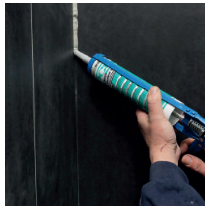
6. Eck-, Anschluss- und Bewegungsfugen elastisch schließen.