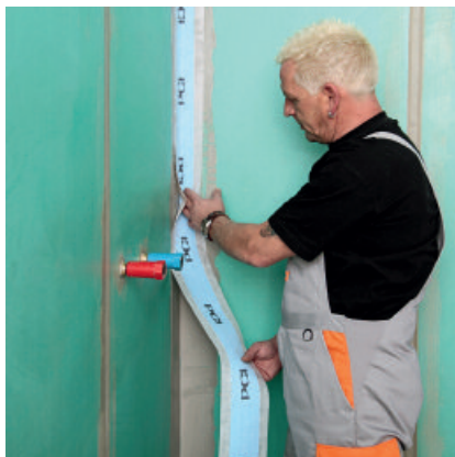
2b. Eck- und Anschlussfugen abdichten. Nachfolgend das Dichtband PCI Pectape mit leichtem Druck in das noch frische PCI Lastogum einbetten.