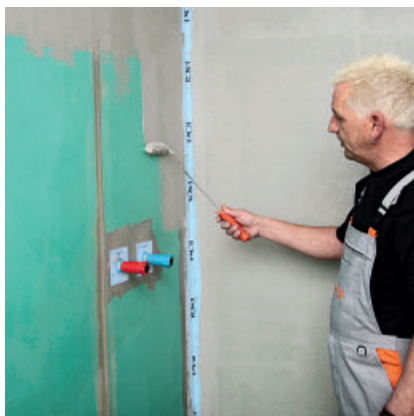
3. PCI Lastogum® in zwei Arbeitsgängen dann flächendeckend auftragen.