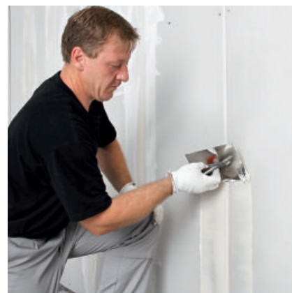
PCI Muroplan – vielseitig anwendbarer Gips-spachtel.